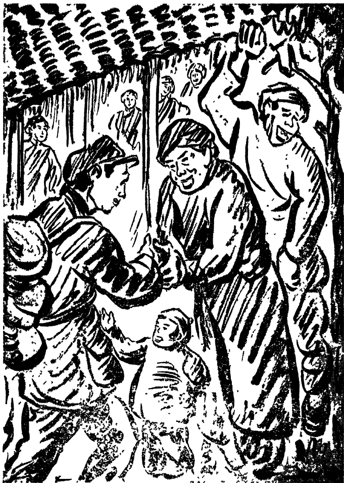
ಭೂಸುಧಾರಣಾದಳದ ಬಂಧುಗಳಿಗೆ ಸುಸ್ವಾಗತ.